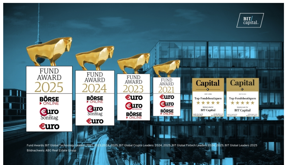
Fund Awards: BIT Global Technology Leaders 2021, 2023, 2024, 2025; BIT Global Crypto Leaders: 2024, 2025; BIT Global Fintech Leaders 2024, 2025; BIT Global Leaders 2025

Mit seinen Investmentprodukten bietet BIT Capital Investoren die Chance, am zukünftigen Wachstum der technologisierten Welt zu partizipieren. Dabei lautet der Anspruch stets „Ahead of the Curve“ zu sein – schon heute dort zu sein, wo Megatrends und die großen Investmentchancen der Zukunft entstehen. Hier navigiert das BIT Capital-Team routiniert durch eine sich ständig verändernde Landschaft komplexer Technologiesektoren und spürt für seine Investoren frühzeitig die Branchenführer von morgen auf.