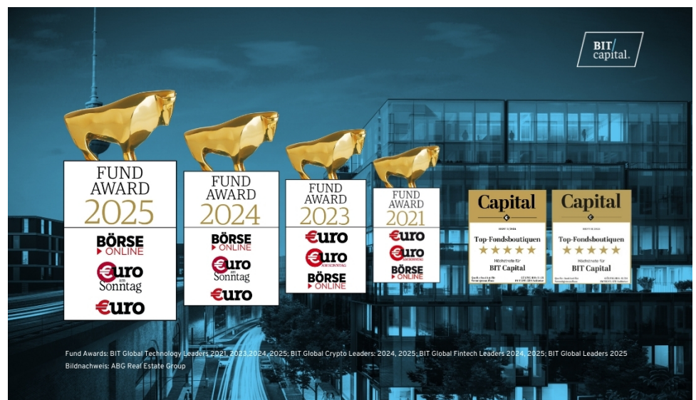
Fund Awards: BIT Global Technology Leaders 2021, 2023, 2024, 2025; BIT Global Crypto Leaders: 2024, 2025; BIT Global Fintech Leaders 2024, 2025; BIT Global Leaders 2025

Mit seinen Investmentprodukten bietet BIT Capital Investoren die Chance, am zukünftigen Wachstum der technologisierten Welt zu partizipieren. Dabei lautet der Anspruch stets „Ahead of the Curve“ zu sein – schon heute dort zu sein, wo Megatrends und die großen Investmentchancen der Zukunft entstehen. Hier navigiert das BIT Capital-Team routiniert durch eine sich ständig verändernde Landschaft komplexer Technologiesektoren und spürt für seine Investoren frühzeitig die Branchenführer von morgen auf.